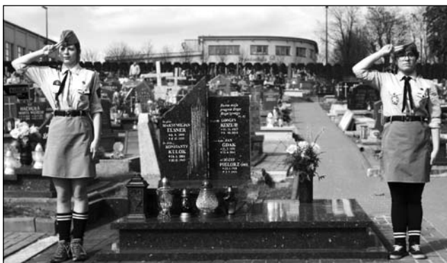
Harcerska warta przy grobie ks. Jana Gdaka na imielińskim cmentarzu.

Po maturze podjął decyzję o wstąpieniu do Wyższego Śląskiego Seminarium Duchownego w Krakowie. Na III roku studiów teologicznych został aresztowany