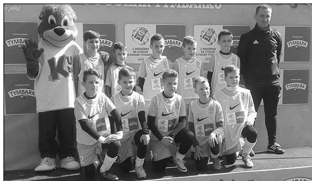
Zawodnicy z drużyny U-12.

Zawodnicy przeszli etapy regionalne i ostatnim etapem, który umożliwił grę na Stadionie Narodowym w Warszawie było zwycięstwo w finale wojewódzkim. Niestety na tym etapie obie drużyny musiały uznać wyższość rywali. - Mimo wszystko nasz występ trzeba uznać za sukces, gdyż jedna i druga grupa znalazła się wśród najlepszych drużyn